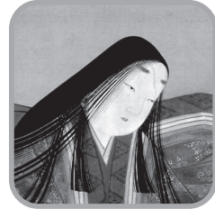
むらかみ しきぶ 紫式部