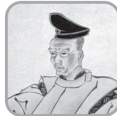
いむらま かげん 近松 門左衛門