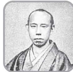
まつだいら しゅんごく 松平 春嶽