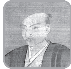
あさくら よしかげ 朝倉 義景