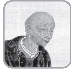
よしだ びやく 杉田 玄白