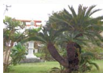
▲ソテツ植栽事業 （2013年度）