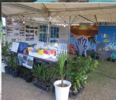
▲サンゴ祭事業（2010年度） サンゴ祭会場に設置された サンゴブース