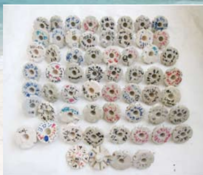
メッセージが書かれた サンゴ増殖用具