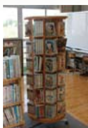
▲与論小学校書庫整備事業 （2009年度）