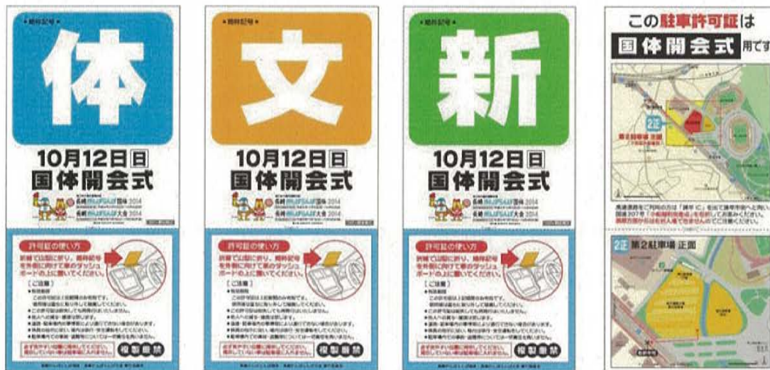
■参考：長崎がんばらんば国体における駐車許可証