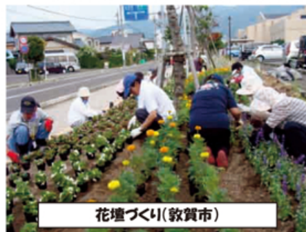
花壇づくり(敦賀市)