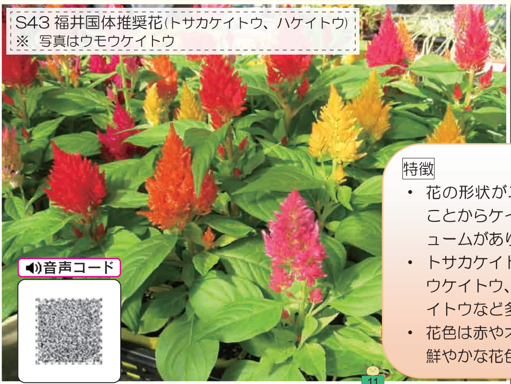
S43 福井国体推奨花(トサカケイトウ、ハケイトウ) ※ 写真はウモウケイトウ