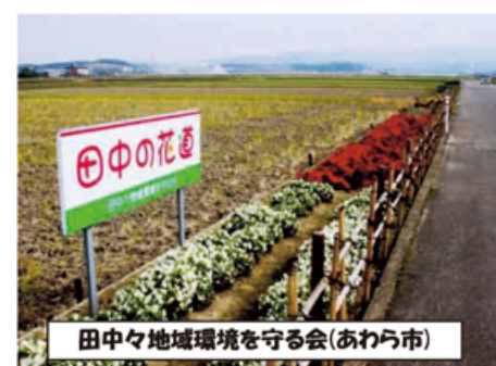
田中々地域環境を守る会(あわら市)