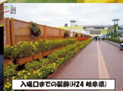
入場口までの装飾(H24 岐阜県)

プランター栽培をはじめ、会場へのアクセス道路や花壇、庭先などに花を植栽して、両大会で全国から訪れる多くの来県者の方を、「花いっぱいの福井県」で温かくお迎えしましょう！