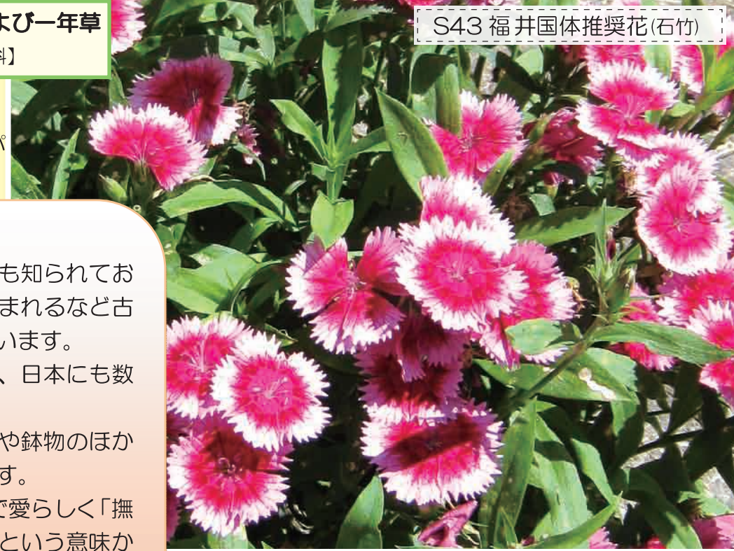
S43 福井国体推奨花(石竹)