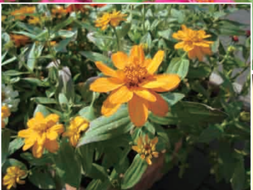
写真上：大輪系 写真下：小輪系