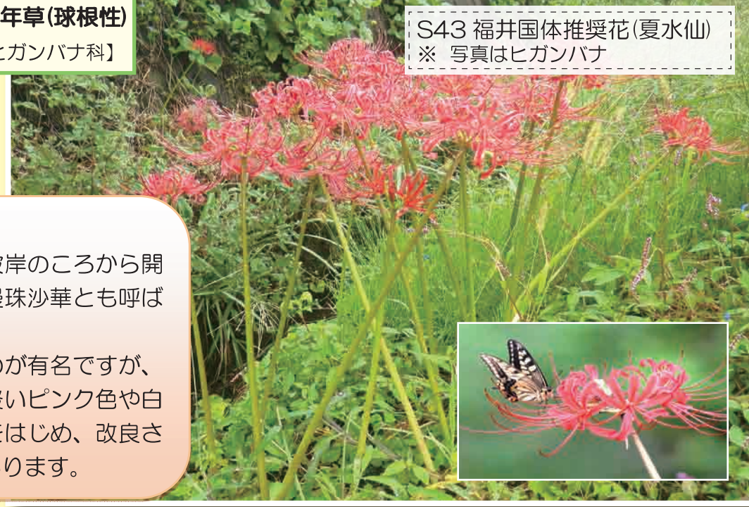
S43 福井国体推奨花(夏水仙) ※ 写真はヒガンバナ