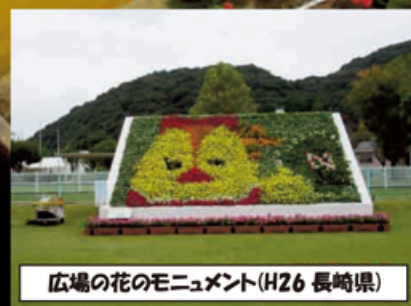
広場の花のモニュメント(H26 長崎県)