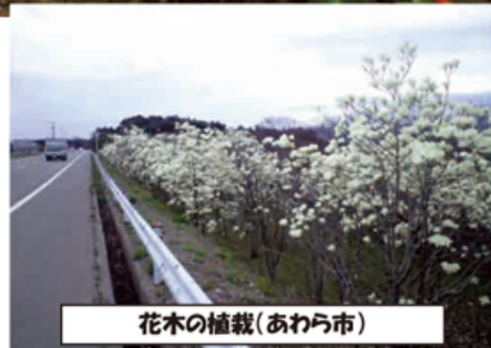
花木の植栽(あわら市)

県総合グリーンセンターの「花の相談所」や地域の花いっぱい運動推進員等にお尋ねください。