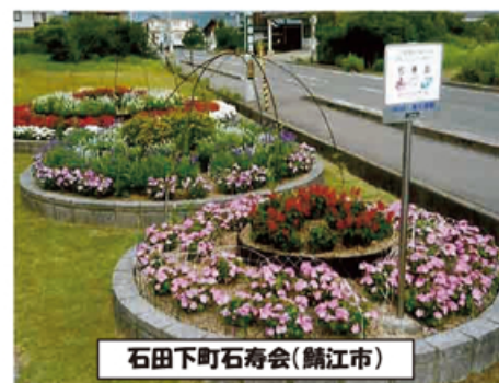
石田下町石寿会(鯖江市)

歩道の植樹ますなどを活用して行う「花の植栽」「清掃」や「除草」等、県管理道路の維持管理の一部を行うボランティア活動(道守活動)に参加しましょう。