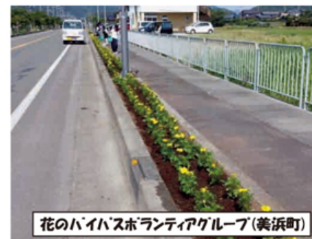
花のハイパスボランティアグループ(美浜町)