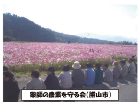
粟師の農業を守る会(勝山市)

農地や用水路の法面の草刈りや農地・農道脇への植栽、地域内の清掃などの活動を通して、ふるさと福井の美しい農村景観づくりに参加しましょう。