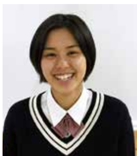
障害スポ競技補助員 (グランドソフトボール) 仁愛女子高等学校

今回の福井しあわせ元気大会に参加させていただき、私は単なる補助員としてだけでなく、1人の人間として多くのことを学ばせていただきました。障害者スポーツ大会は普段生活しているだけでは気づくことのできない大切なことに気づかせてくれる大会だと思います。この障害者スポーツ大会が今後受け継がれ、もっと多くの方がこの大会に関わり、様々な学びを得られることを願っています。