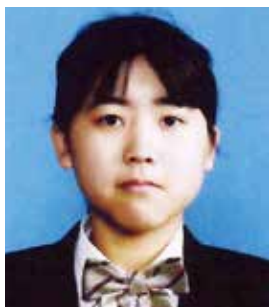
競技補助員 福井県立福井農林高等学校