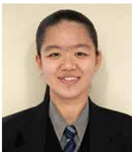
障スポ開閉会式 式典補助員 (会場係 丸椅子担当) 県民参加イベント出演者 啓新高等学校