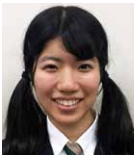
国体総合開閉会式・ 障スポ開閉会式 式典音楽隊(吹奏楽隊) 福井県立武生商業高等学校 吹奏楽部

来年は、茨城で国体・障スポが行われます。地元ではなくとも、国民として貢献していけたらと思います。