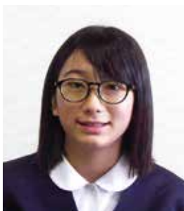
国体総合開会式 都道府県応援団 福井市立社北小学校