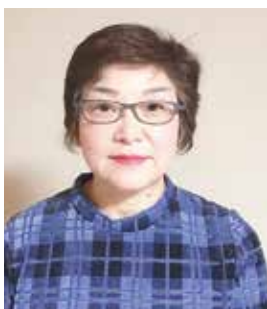
運営ボランティア

障害者スポーツ大会を間近で観戦できたことで、障がい者の方々が、健常者と変わりなくスポーツに参加されていることを身近に感じました。障がい者の方々とも、心を込めて接すれば、理解し合えるということが分かりました。機会があれば、今度は一緒にスポーツを楽しみたいです。