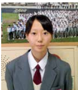
障スポ開会式 都道府県応援団 福井市立社中学校

今回は、貴重な経験をさせていただきました。私にとって福井国体の記憶は、大切な宝物です。