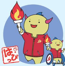
はぴりゅう 「福井しあわせ元気」国体・障スポ マスコットキャラクター