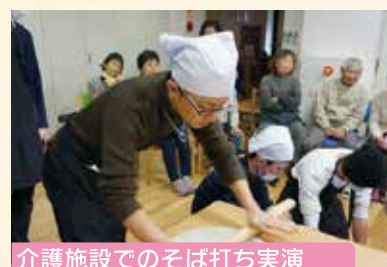
介護施設でのそば打ち実演