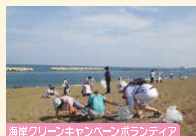
海岸クリーンキャンペーンボランティア