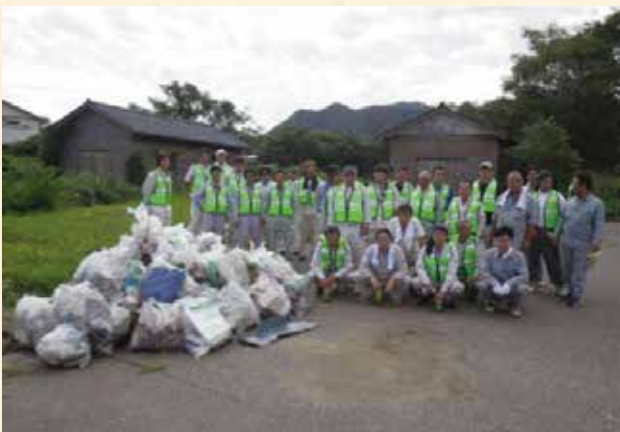
鷹巣海岸の清掃活動

地域の方からは、会員の皆が奉仕活動をしているも、当初は、委託清掃作業と思われることもありましたが、毎年奉仕活動をするうちに、「今年もありがとう！」と地域の方々から声をかけてもらうこともあり、喜びを感じていますとのことでした。