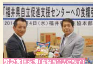
緊急食糧支援(食糧贈呈式の様子)

両社とも素晴らしい活動で、関係地区や住民等に貢献しています。また、上記企業(団体)以外にも県内の多数の企業(団体)がボランティア活動を実施・支援しており、認証を受けています。各認証企業(団体)の活動についてはFパネットホームページ(「Fパネット 応援」で検索してください)に掲載しています。ぜひご覧ください。