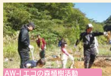
AW-1 エコの森植樹活動