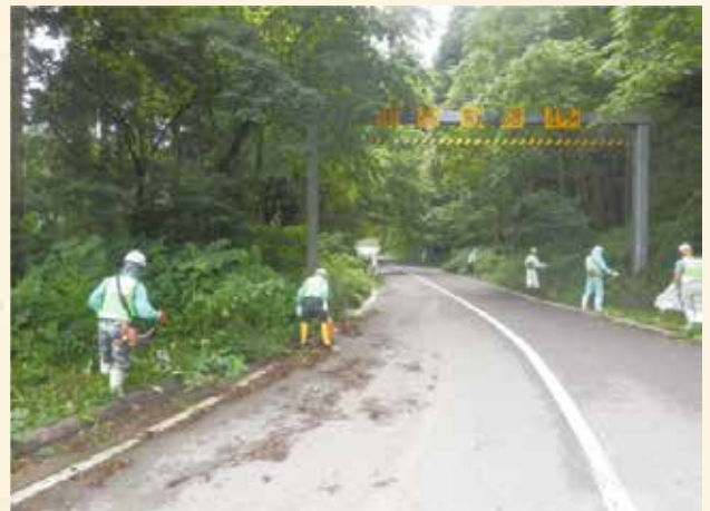
足羽・美山地区の清掃活動

また、この社会貢献活動を通じて、会員同士の交流・親睦が深まったことも大きな収穫でした。普段はそれぞれの会社・職場で、別々に働いており、ゆっくり顔をあわせて話す機会も少ないですが、この清掃・美化活動を皆で一緒に取り組むことにより、会員同士の横のつながりもできました。