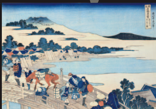
葛飾北斎 / 諸国名橋奇覧 ちちぜんふくみの橋 天保4~5年(1833~34年)頃