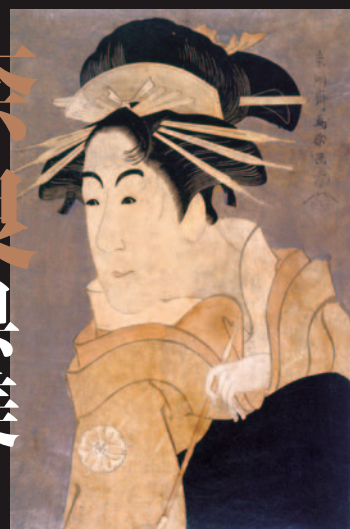
東洲斎写楽 / 松本米三郎のしづ 寛政6年(1794年)